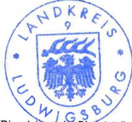
(Dienstsiegel der Dienststelle des Kreiswahlleiters)